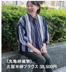
(丸亀絣織物) 久留米絣ブラウス 38,500円