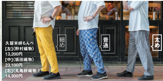
久留米絣もんぺ [左](野村織物) 13,200円 [中](坂田織物) 23,100円 [右](丸亀絣織物) 14,300円