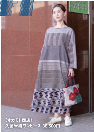
(オカモト商店) 久留米絣ワンピース 38,500円

山村善昭かすり工房 藍染工房 山村健 野村雅範絣工房 富久織物工房 野口織物 下川織物 久保かすり織物 野村篤子絣工房 西原織物 井上絣店 西原糸店 うなぎの寝床 (順不同)