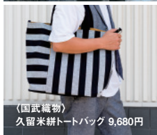
(国武織物) 久留米絣トートバッグ 9,680円